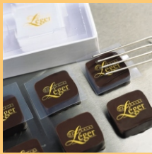
"Individuelles" = alleinstehendes Logo