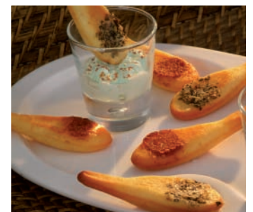
In der salzigen Version klein Gebäck