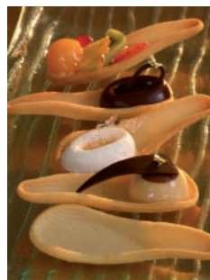
Löffel als Tartelettes mit Silform® Ref 1127 hergestellt

Es handelt sich um eine große Premiere, die neue Form Löffel mit der Ref. 1127 wurde vor Kurzem aus Flexipan® oder aus Silform® herausgebracht und bietet Ihnen so die verschiedensten Möglichkeiten! Schneiden Sie zum Beispiel mit dem Silform® Löffel ein Stück Mürbeteig mithilfe des Ausstechers (Ref. DEC 01127, der Löffel-Form angepasst) aus und legen Sie es auf die Rückseite des Abdrucks. So erhalten Sie ein Törtchen in