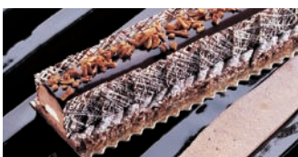
Flexipan® Einsatz für Weihnachtskuchen Ref. 1454 - 339 x 40 mm, Tiefe 39 mm