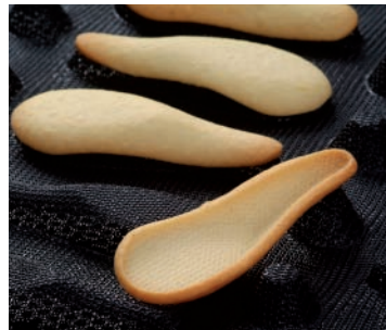
Silform® Löffel Ref. SF 1127

MIT SEINER NEUEN FORM – DEM LÖFFEL - REVOLUTIONIERT DEMARLE ERNEUT DIE WELT DER WEICHEN BACKFORMEN.