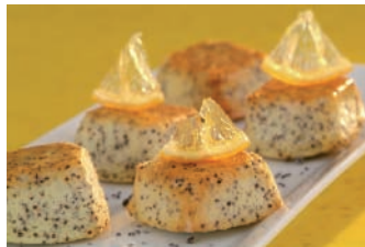
Kleine Zitronen Mohn Kuchen mit der Ref. FP 1128 hergestellt

56 x 56 mm Tiefe 24 mm 600 x 400 mm Ref. 1133 35 Form.