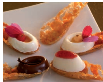
In der Nugat-Version

In der selben Weise erhalten Sie mit einem salzigen Teig Löffel „à la Traiteur“ für Ihre Buffets mit exquisitem Kleingebäck. Auch hier bietet sich die Form ausgezeichnet für leichte Füllungen, die in einem Siphon zubereitet werden, oder Gemüse- oder Fisch-Mousse.