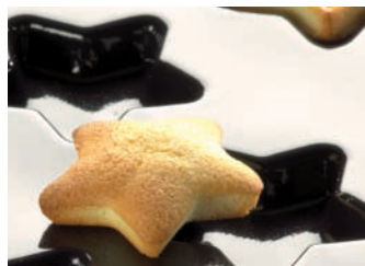
Flexipan® Sterne Ref. 1061 80 x 65 mm, Tiefe 15 mm

^ Die Form Tannenbaum (Ref. 382 oder 392), die Form Schneemann (Ref. 435) oder die Form der in Frankreich traditionellen Weihnachtsbrioches (Ref. 343 oder 387) sind vorzüglich für die Feste des Jahresendes geeignet.