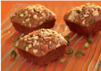
Brownies mit der Ref. FP 1133 gebacken

Demarle präsentiert Ihnen seine neuesten Formen, die die Reihe der quadratischen Formen vervollständigen.