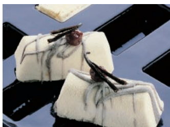
Flexipan® Mini Röllchen Ref. 1039 95 x 40 mm, Tiefe 30 mm

Der Einsatz ist auch in der Größe 339 x 40 mm mit einer Tiefe von 39 mm verfügbar, Ref 1454 , 8 Formen in 600 x 400 mm.