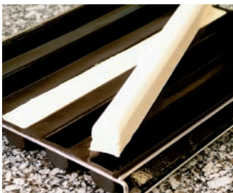
Einsatz für Weihnachtskuchen 495 x 40 mm Tiefe 39 mm 600 x 400 mm Ref. 1464 5 Form.

FÜR DIESE GELEGENHEIT GIBT ES DIE FORMEN AUS FLEXIPAN®.